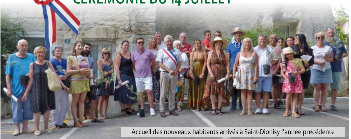
Accueil des nouveaux habitants arrivés à Saint-Dionisy l'année précédente