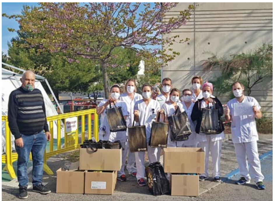
La distribution des chocolats au personnel du CHU