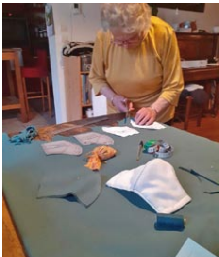
La fabrication des masques...

« Pour nous, c'est normal d'aider, c'est dans notre culture. Et du coup cette période nous a semblé moins pesante, moins ennuyeuse. Et quand on se rencontre mainte-