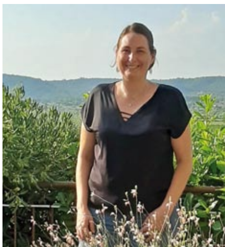
LA TABLE D'AZORD

Trois restaurateurs passionnés aiguisent nos papilles et participent à l'animation de notre village. Ils concoctent, chacun dans leur domaine, des plats savoureux que nous vous invitons à découvrir (ou à redécouvrir).