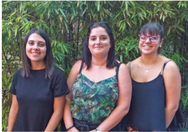
Les jeunes engagés dans le service aux seniors