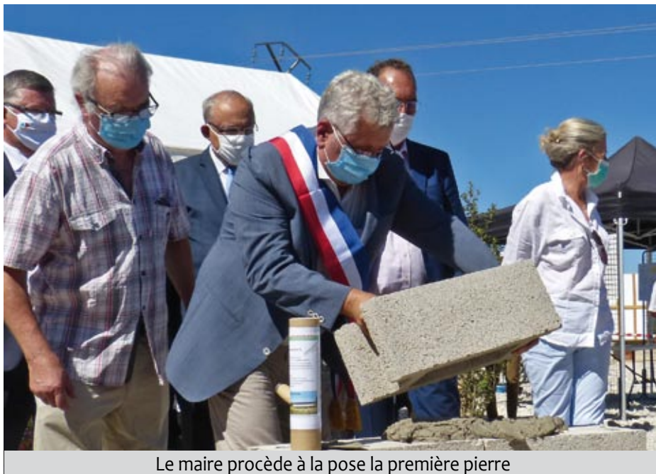
Le maire procède à la pose la première pierre