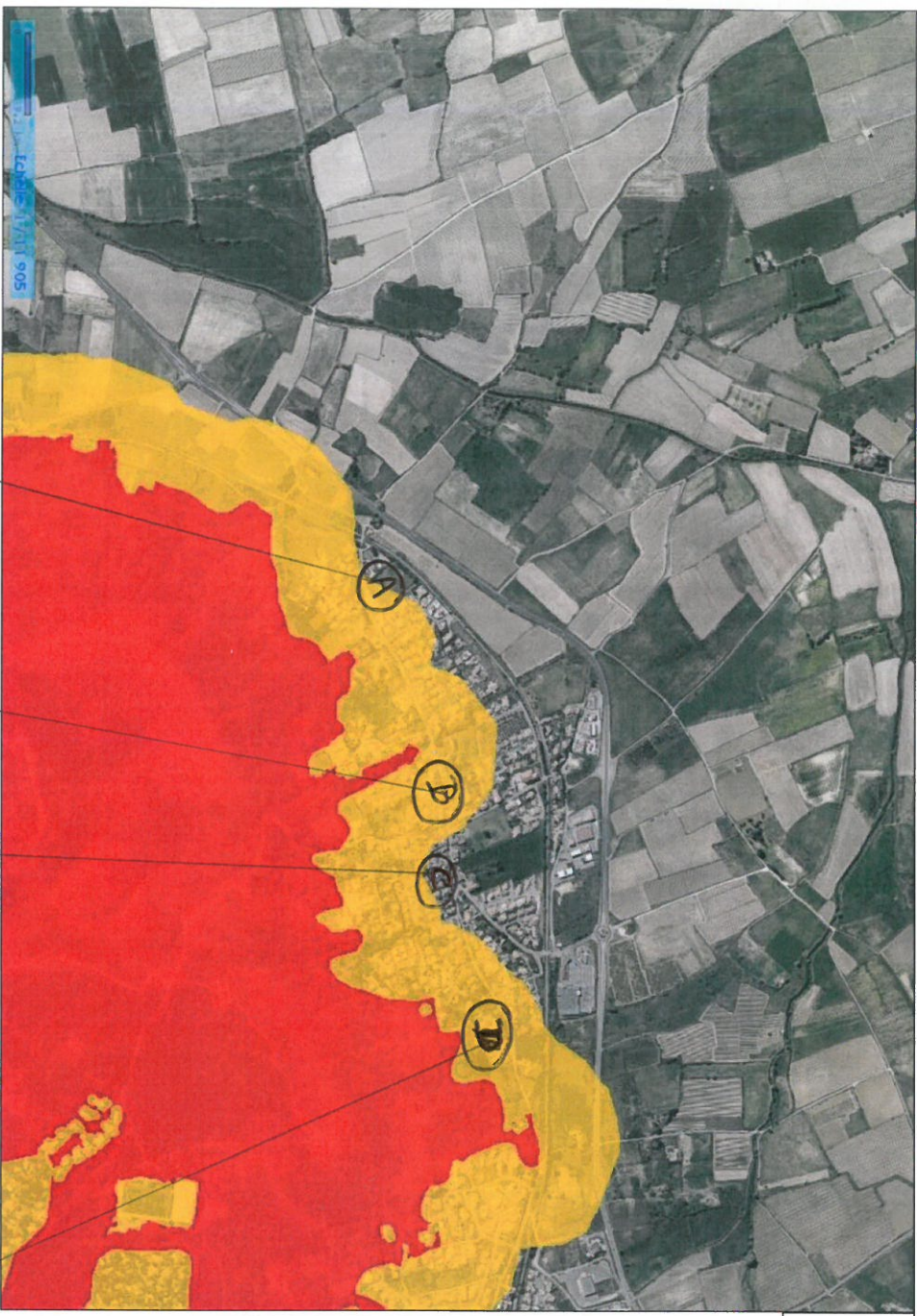
Carte fond de plan